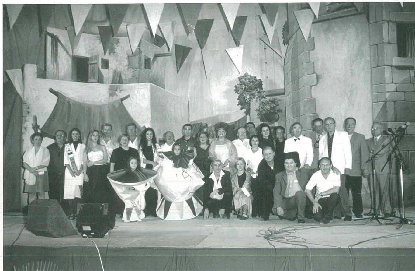
GRAN VETLLADA MUSICAL D'AHIR I D'AVUI (V)