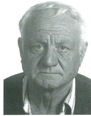
per PERE SANS

Es diu que el teatre és una de les cultures més àmplies que existeixen. Llavors, si ens acollim a aquesta teoria, encara que siga com a amateurs, representant obres de teatre, hem de procurar fer un bon ús d'aquesta teoria en posar-la en pràctica.