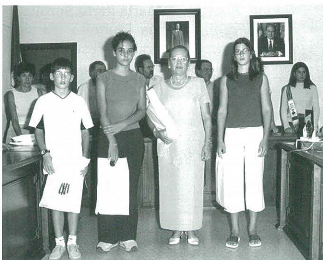
Guanyadors de la Categoria E